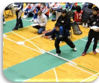
フライングディスク部