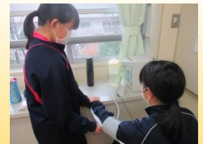
【バイタルチェック】