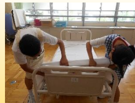
【ベッドメイキング】

環境衛生の知識や高齢者とのコミュニケーションをはじめ車椅子の操作や食事介助・入浴介助などの基本的な技術について学んでいきます。